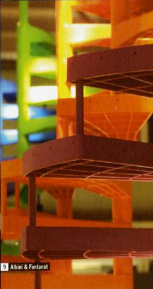
9 Albini & Fontanot