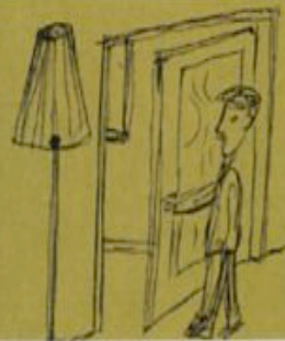
Il violinista diede un'occhiata curiosa alla prima stanza. L'autista rimase di stupefatto. The violinist glanced curiously into the first room. The driver was dumfounded.