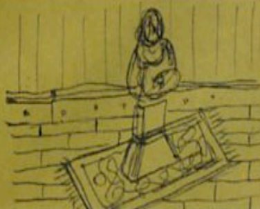
I pavimenti a lunghissimi listelli in legno erano cerati e lucidi. The long narrow floorboards were waxed and polished.

This glass mosaic collection creates ever-changing patterns through the use of colour, combining warm and cold shades, or using one plain colour, laid vertically or horizontally in seven delicately shaded hues. Mounted onto 30x30-cm mesh, using 1.7x1.7-cm tiles, "Chroma" comes in five families, each comprising three colours, and also pure white. It is versatile and can be matched with other Casamood and Casa dolce casa collections.