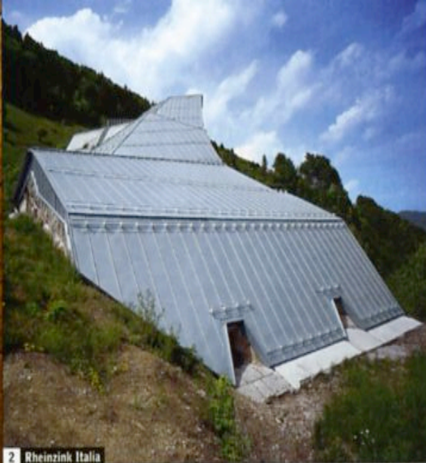
2 Rheinzink Italia